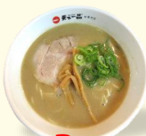
ミニ らーめん 税込 670 円