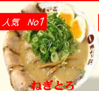
ねぎとろ チャーシュー麺 税込 1150 円