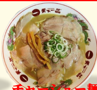
チャーシュー麺 税込 1020 円