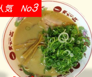
ネギらーめん 税込 950 円