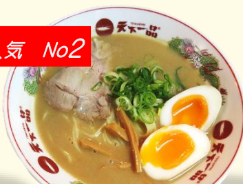
味玉らーめん 税込 930 円