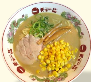
コーンらーめん 税込 930 円