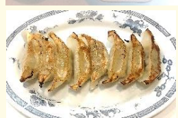
餃子 8 個 税込 430 円