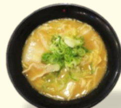
味がさね 並 税込 1000 円 大 税込 1150 円 ※ 特大は提供しておりません