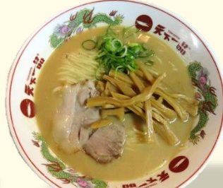
メンマらーめん 税込 930 円