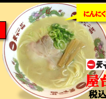
あっさり 税込 820 円