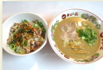
ピリ辛チャーシュー丼定食 税込 980 円