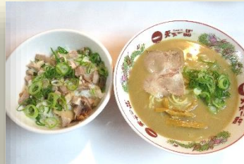
旨タレチャーシュー丼定食 税込 980 円