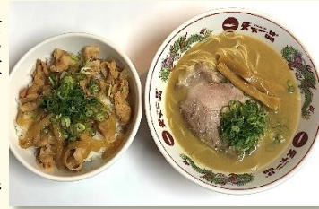
スタミナ丼定食 税込 1000 円