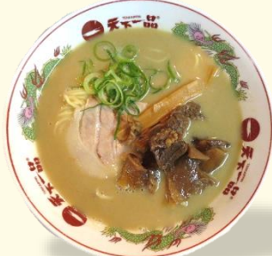
牛すじらーめん 税込 1080 円