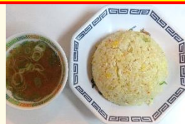
チャーハン 税込 530 円

※スープ増量 (こってりのみ 100cc) 税込 100 円 ※追加注文はできません。