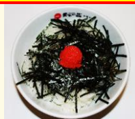
明太子風 和え物ごはん 税込 310 円