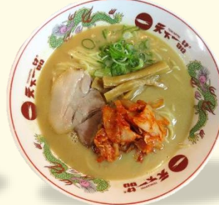
キムチらーめん 税込 970 円