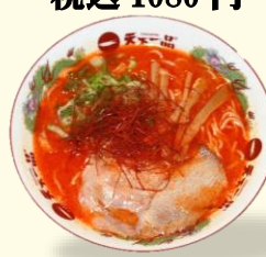
辛コクらーめん 税込 980 円 2辛...プラス 税込 110 円 3辛...プラス 税込 220 円