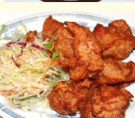
唐揚げ 6 個 税込 500 円