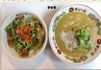
スタキム丼定食 税込 1050 円