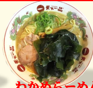
わかめらーめん 税込 930 円