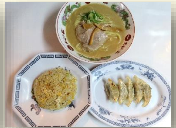
サービス定食 税込 1200 円