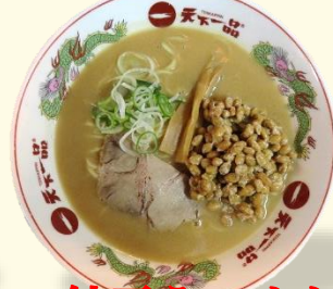
納豆らーめん 税込 930 円