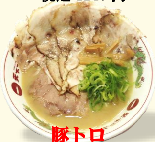
豚トロ チャーシュー麺 税込 1030 円