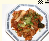
豚キムチ 税込 500 円