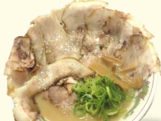
豚トロ2倍盛り チャーシュー麺 税込 1240 円