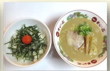
明太子丼定食 税込 960 円