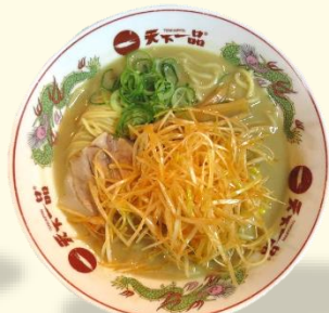
ピリ辛白ネギらーめん 税込 1020 円